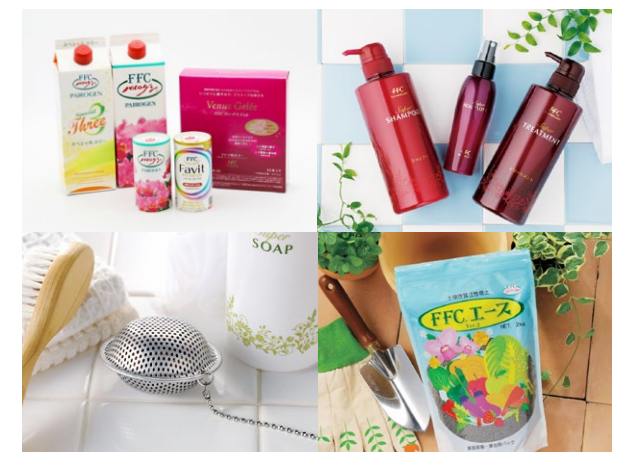
FFCテクノロジーから誕生した各種FFC製品

FFCテクノロジーとは赤塚植物園グループが開発した、水を改質活性化する技術のことで、パイロゲンをはじめとするFFC製品にはこの技術が応用されています。FFC製品は家庭や各種産業で利用され、健康・環境・経済の改善に役立てられています。